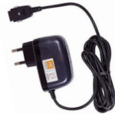
표준 TTA 충전기